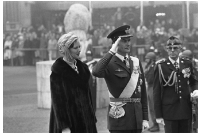
Figura 3. Margarita II de Dinamarca y el príncipe Enrique (1975).

El título de príncipe consorte caló en las monarquías europeas. A pesar de que fue Reino Unido quien popularizó el modelo, este tratamiento no volvió a usarse después de la muerte de Alberto. En 1952 ascendió al trono británico la reina Isabel II