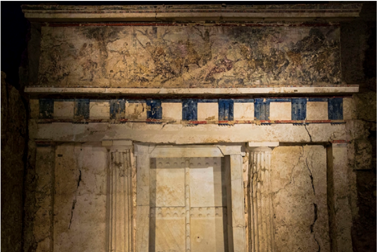
Figura 3. SEQ Figure \*ARABIC 3: Fachada de la Tumba 2 de Vergina. Fotografía de Guillén Pérez. Fuente . Licencia: CC BY-ND 2.0.

Borza y Palagia suman a su lista de argumentos la construcción en bóveda de las Tumba II, situándose en la línea de Thomas Boyd, de que este tipo de construcciones solo se introdujeron en Macedonia tras la conquista de Alejandro (Borza y Palagia, 2007) sin embargo, Antonio Ignacio Molina Marin , en un artículo publicado en el mismo año 2007 recuperó el argumento esgrimido por Hammond en el que este tipo de enterramientos no eran nada nuevo cuando Alejandro conquistó el Imperio Persa, por lo que este argumento cabría eliminarlo (A favor de que las bóvedas se incorporaron después de la campaña de Alejandro: Borza y Palagia, 2007; en contra: Molina, 2007).