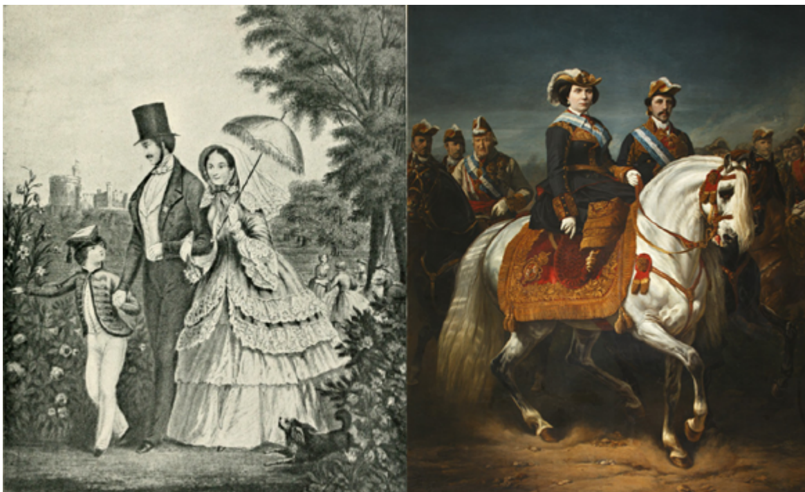
Figura 1. a) El futuro Eduardo VII con sus padres, la reina Victoria y el príncipe Alberto (Alexander Meyrick Broadley, c. 1847). Fuente . Licencia: Dominio Público. b) Retrato ecuestre de Isabel II de España y el rey Francisco de Asís (Charles Porion, 1867). Museo del Romanticismo. Fuente . Licencia: Creative Commons Attribution-Share Alike 4.0 International.

Posiblemente la reina más conocida en el siglo XIX sea Victoria del Reino Unido, quien ascendió al trono con dieciocho años en 1837. En 1840 contrajo matrimonio con su primo, el duque Alberto de Sajonia-Coburgo y