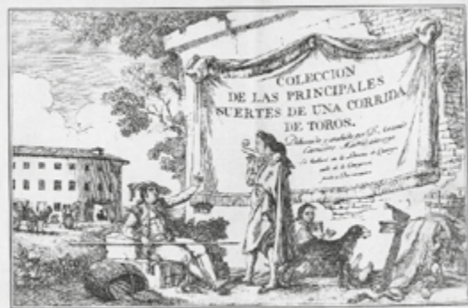
Figura 2. Antonio Carnicero, Colección de las principales suertes de una corrida de toros [Material gráfico] / distribuida y grabada por Antonio Carnicero, (1790, Biblioteca Digital de Castilla y León). Fuente . Licencia: Dominio Público.

Por otro lado, Nicolás Fernández de Moratín (1737-1780) fue un ejemplo de pensador con una postura favorable a la fiesta de los toros. Él participó en el panorama ilustrado de la España del momento como en La Tertulia de la Fonda de San Sebastián o la