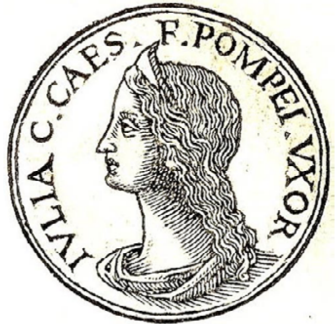
Figura 2. Julia, hija de Julio César y esposa de Pompeyo Magno.

A pesar de sus matrimonios, César no tuvo ningún problema en conquistar a diversas amantes, siendo la más famosa Cleopatra (Roller, 2010, p. 61). Tal se dice que era su actitud con las mujeres, que incluso el tribuno de la plebe Helvio Cina llegó a extender el rumor, fuera cierto o no, de que César le había ordenado redactar una ley por la que este pudiera casarse con cuantas mujeres deseara, aunque alegaba que solo con el propósito de engendrar a un heredero. De hecho, sus propios soldados, por la gran confianza que tenían con su general, le cantaban cancioncillas satíricas las cuales eran incluso