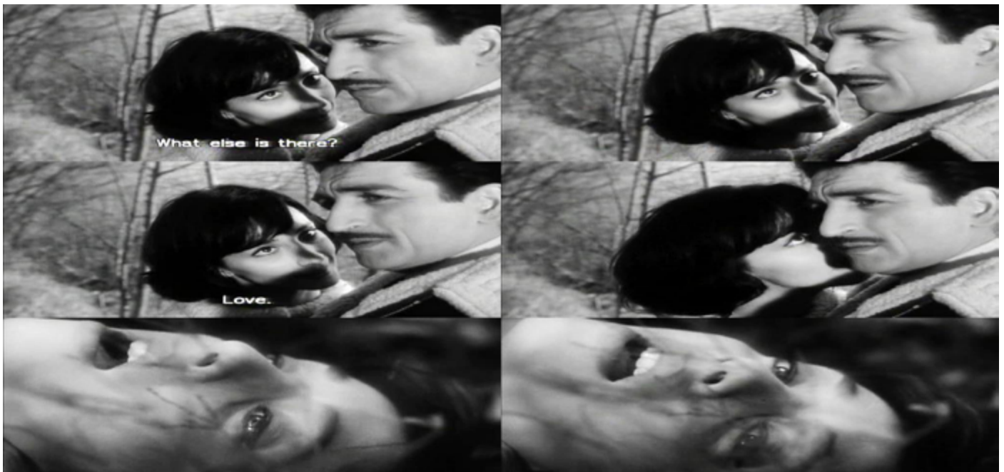
Figura 3. Doble frame extraído de Les bonnes femmes (1960) de Claude Chabrol. Jacqueline exhala su último aliento, asesinada por su acosador. Fuente. Licencia: Attribution-NonCommercial-NoDerivs 4.0 International.

lugar sin justificación para la trama. Consiste en una exhibición erótico-festiva de una bella joven rubia, que va desnudándose al ritmo de la música. La única función que cumple es salir para poder ser observada . Como dice Mulvey: