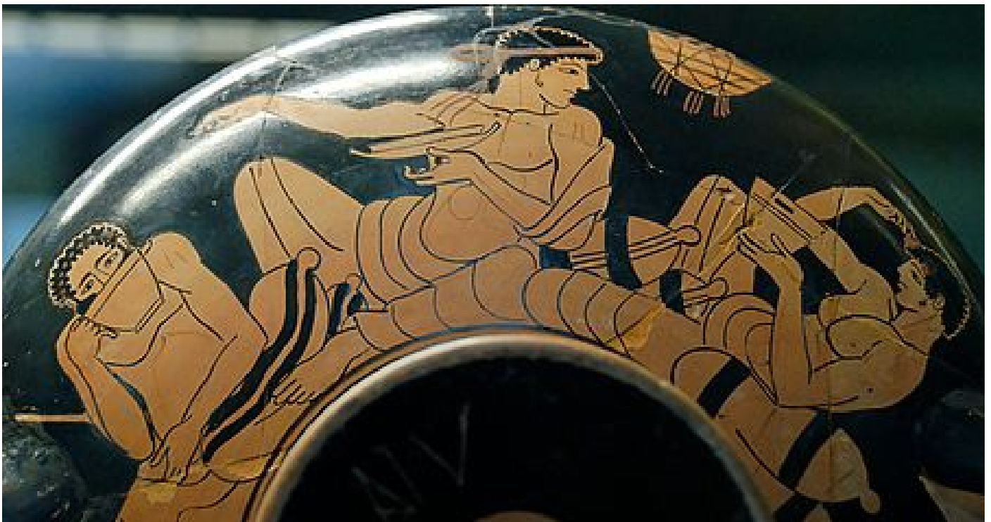
Figura 1. Medallón de una copa de cerámica ática de figuras rojas (490-480 a. C.) En el cual se observan tres figuras, la del medio sujetando una cílica y las dos figuras de los laterales unos vasos esquifos. Museo del Louvre, Paris.

La gastronomía tal y como la conocemos hoy en día era desconocida para los antiguos griegos. Por otro lado, hay centenares de fuentes escritas y visuales sobre cómo se llevaban a cabo diferentes aspectos alrededor del hecho de comer. Ya en el siglo II a.C, autores como Aristoteles, mencionan los tipos de pescado que se consumía y los tipos de pan que se producían (Monroy, 2000, pp. 2-5). Un siglo más tarde Ateneo de Naucratis (2016) en su obra Banquete de los Eruditos hablaría sobre recetas de cocina y el proceso de los banquetes. Estos escritos, junto a otras como la Odisea o la Iliada de Homero, abordaban el hecho de comer como algo totalmente dependiente del ser humano y sus divinidades, haciendo imposible referenciar a las mujeres, hombres, diosas y dioses sin mencionar aspectos sobre el arte de comer, la comida que se consumía o la importancia de los banquetes.