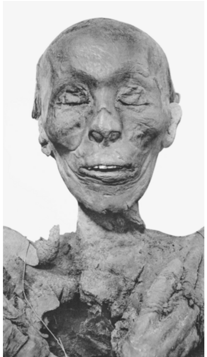
Figura 2. Posible momia de Tutmosis II. Fuente. Licencia: Dominio Público.

La tumba se caracteriza por un diseño arquitectónico sencillo, propio de los miembros de esta dinastía, y