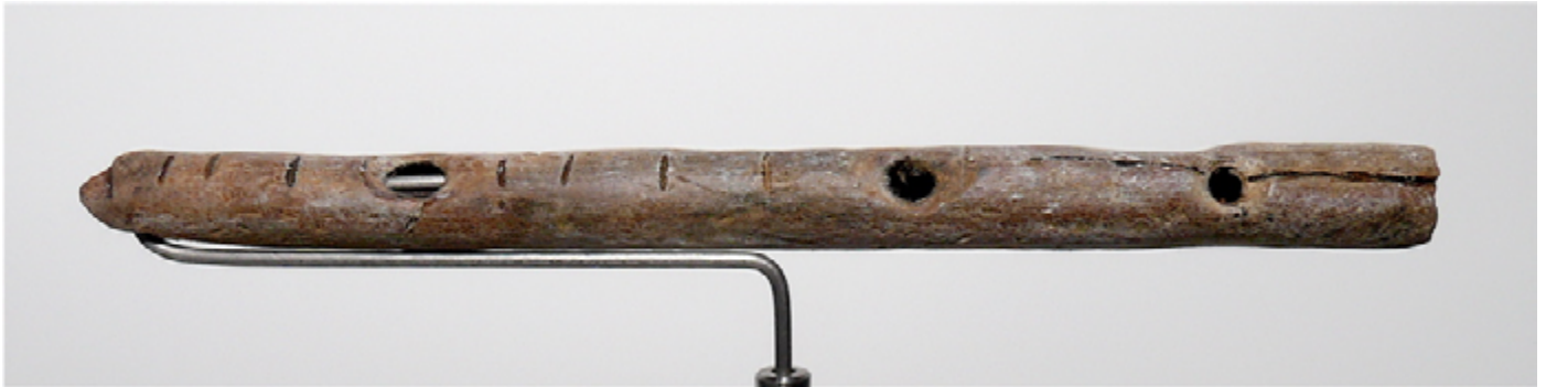
Figura 2. Flauta paleolítica auriñaciense procedente del yacimiento de Gißenklösterle.

lo que parece indicar una inquietud por conseguir una mayor variedad de sonidos (Sánchez, 2019, p. 202). Los huesos perforados o flautas son los instrumentos más encontrados. Suelen estar fabricados a partir de diáfisis de huesos largos de animales de tamaño pequeño o mediano, como las aves, liebres o ciervos. Además, la materia prima parece ser la clave para conseguir el mejor sonido. Se tiene cuidado a la hora de la selección de especies, así como de las partes anatómicas y el estado de la materia prima -trabajo en fresco- (Baena et al., 1997, p. 3).