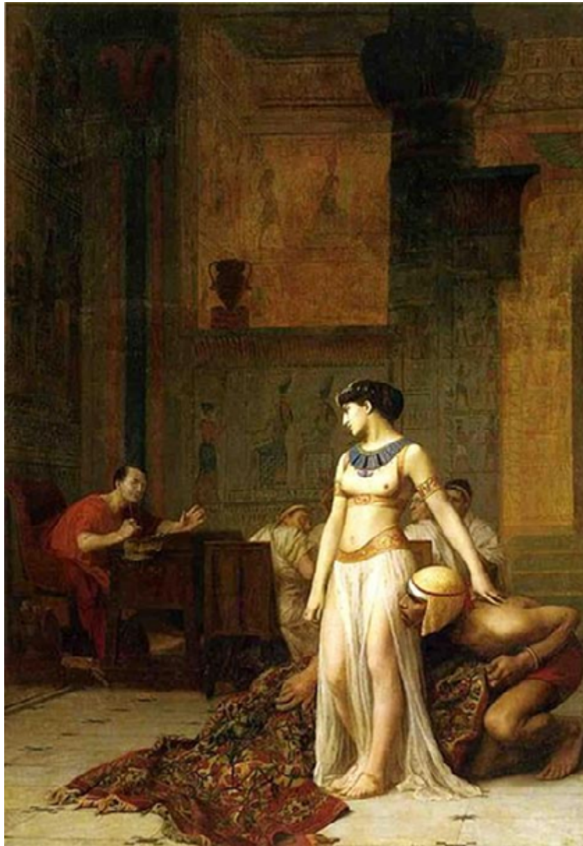
Figura 3. Cleopatra y César, óleo de Jean-León Gérôme (1866).