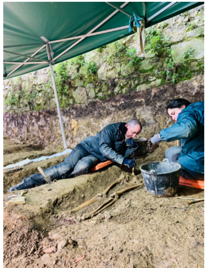
Figura 1. Excavación en proceso.

Los antropólogos forenses , conocidos como los «intérpretes de los muertos», se encargan, a través de la observación minuciosa y la aplicación de diferentes métodos, de determinar características clave como la edad, el sexo, la estatura y el posible origen étnico de los restos. Además, colaboran con técnicas avanzadas de identificación genética, como