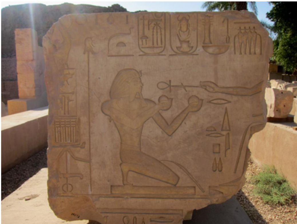
Figura 1. Relieve de Tutmosis II en Karnak. Fuente . Licencia: Creative Commons Dedicación de Dominio Público CC0 1.0 Universal.

Fallecido en el 1513 a.C., será sustituido por su esposa Hatshepsut , quien se autoproclamará reina faraón de Egipto.