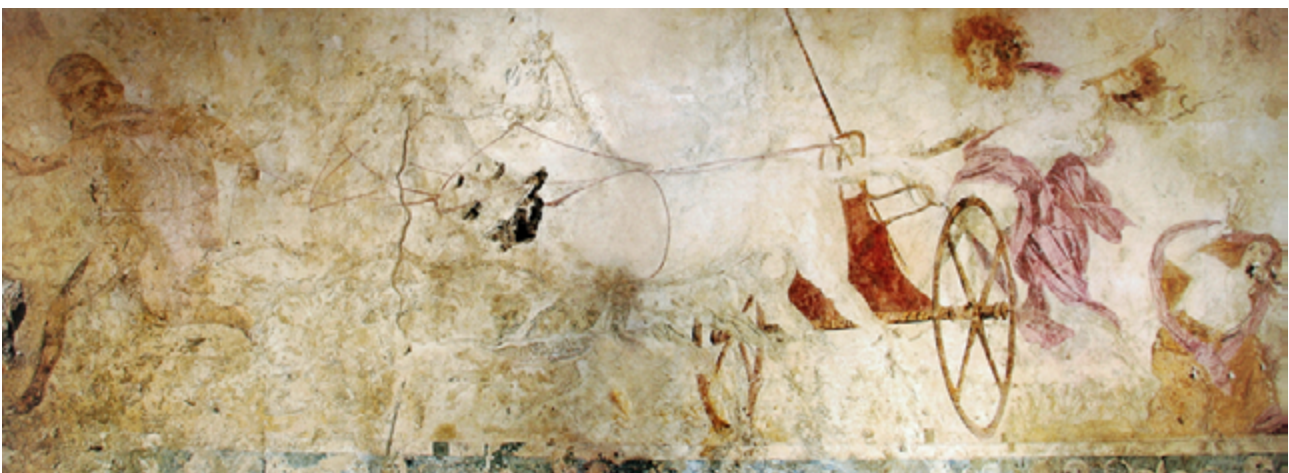
Figura 1. SEQ Figure \* ARABIC 1: Rapto de Perséfone, fresco de la Tumba I. Fuente . Licencia: Dominio público.

Las que nos interesa a nosotros es la Tumba II, la cual, según Andronikos, contenía los restos de Filipo II de Macedonia. La Tumba II tiene una fachada de 10 metros de ancho y cinco y medio de alto, dos pilastras que cierran la parte exterior de la fachada y dos columnas estriadas de orden dórico (Agudo, 2024). Lo más destacable es el fresco de la fachada, una escena de caza en la que aparecen siete