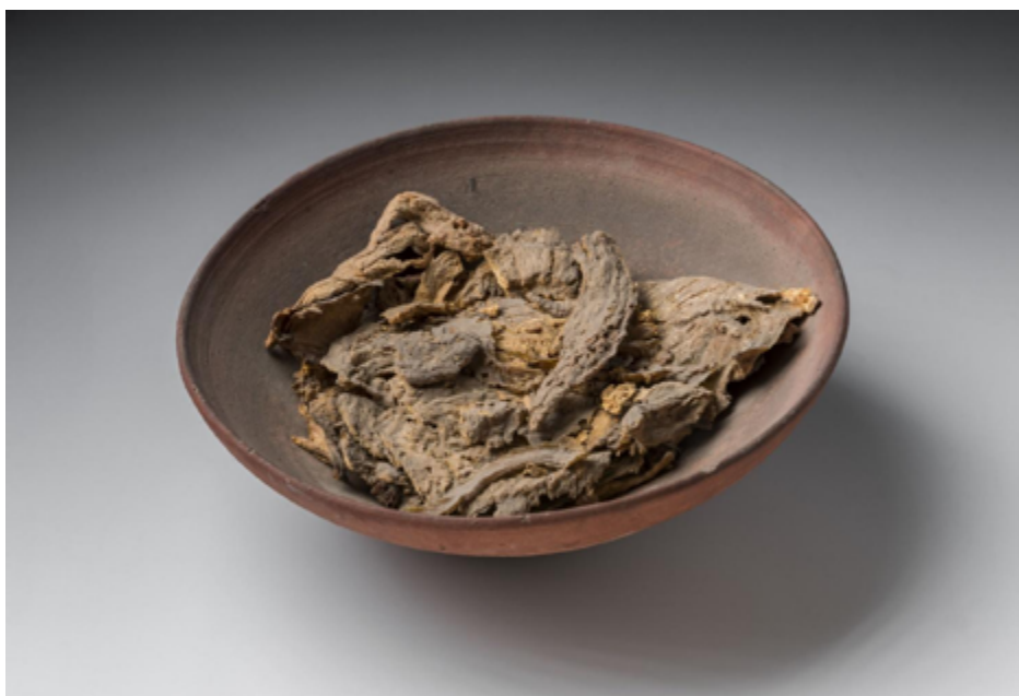
Figura 1. Cuenco con pescado (s. 8321) de la tumba TT8. Fuente . Licencia: Dominio público.

El Ka , si bien es difícil de definir con exactitud, se suele mencionar como “la energía vital o el doble”, nace con el individuo, lo guía en su vida y en su muerte (Ikam, 2019). Se asegura el sustento de alimentos para que el difunto pueda seguir viviendo en la otra vida, por lo cual, es sumamente importante su alimentación, y en caso contrario, él tendrá que recurrir a acciones aberrantes para su supervivencia.