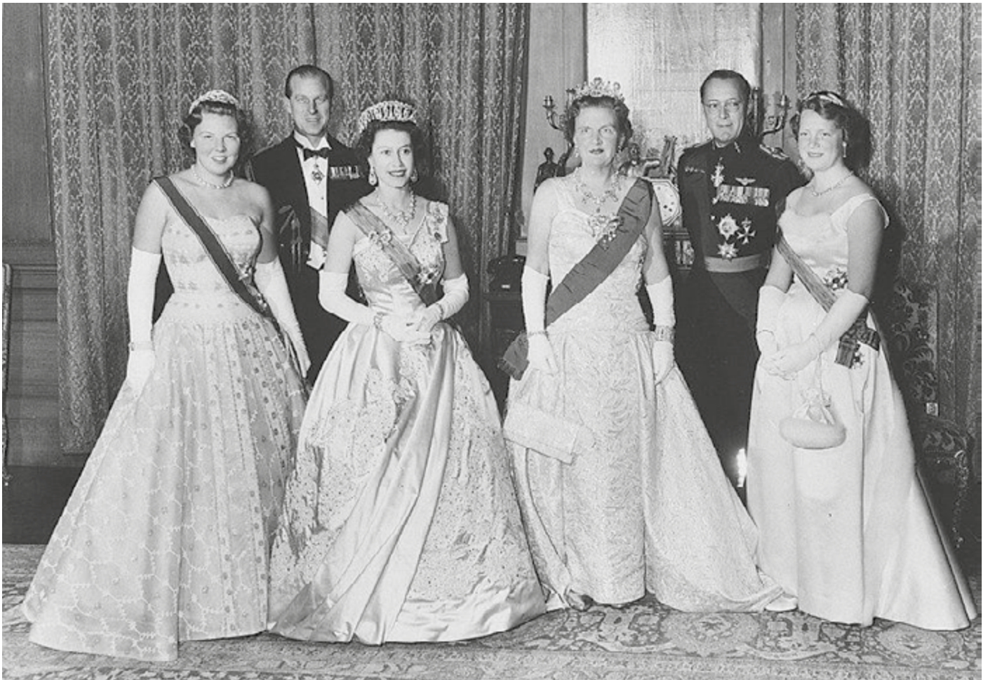
Figura 2. Isabel II de Reino Unido y el príncipe Felipe junto a la reina Juliana de los Países Bajos y su familia (1958).