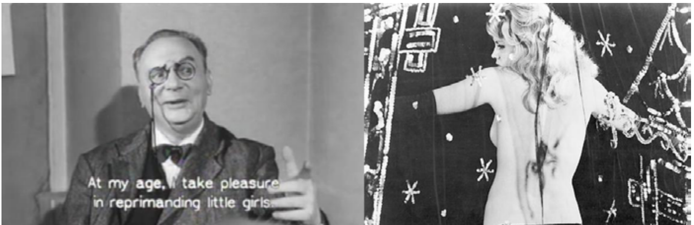
Figura 2. a) Frame extraído de Les bonnes femmes (1960) de Claude Chabrol. Vemos al jefe de la tienda donde trabaja Jacqueline reconociendo que disfruta de reprender a las jovencitas cuando se queda a solas con ellas. Fuente. Licencia: Attribution-NonCommercial-NoDerivs 4.0 International. b) Frame extraído de Les bonnes femmes (1960) de Claude Chabrol. Una actriz rubia, Dolly Bell, inicia un espectáculo erótico, interrumpiendo el hilo argumental de la película. Fuente. Licencia: Attribution-NonCommercial-NoDerivs 4.0 International

mirada del hombre y la perspectiva femenina a través de Agnès Varda, directora y coetánea del primero.