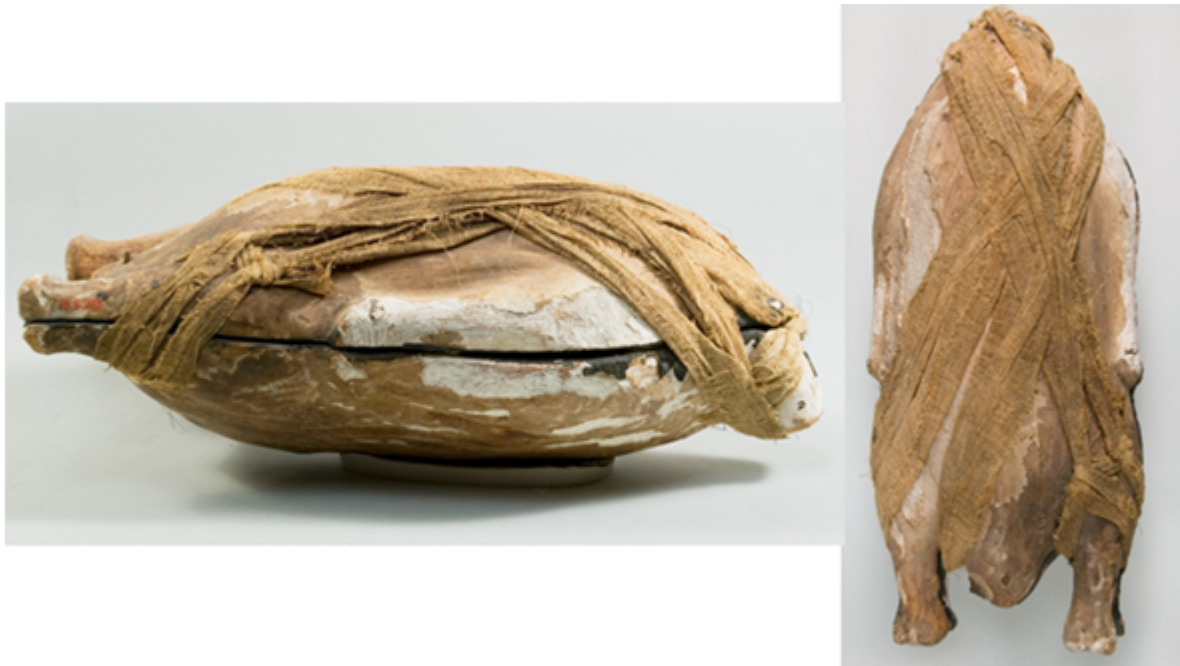
Figura 2. Caja de comida de la MMA 1021 (19.3.275).