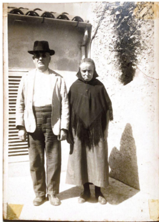
Figura 1. Antiguos campesinos del pueblo de Artá (Mallorca) alrededor del año 1900.

El análisis topográfico que hemos realizado con el estudio arqueológico nos ha permitido esclarecer un error muy común que se tiende a pensar en la vida de estos campesinos. Cabe preguntarse: ¿los roters ,