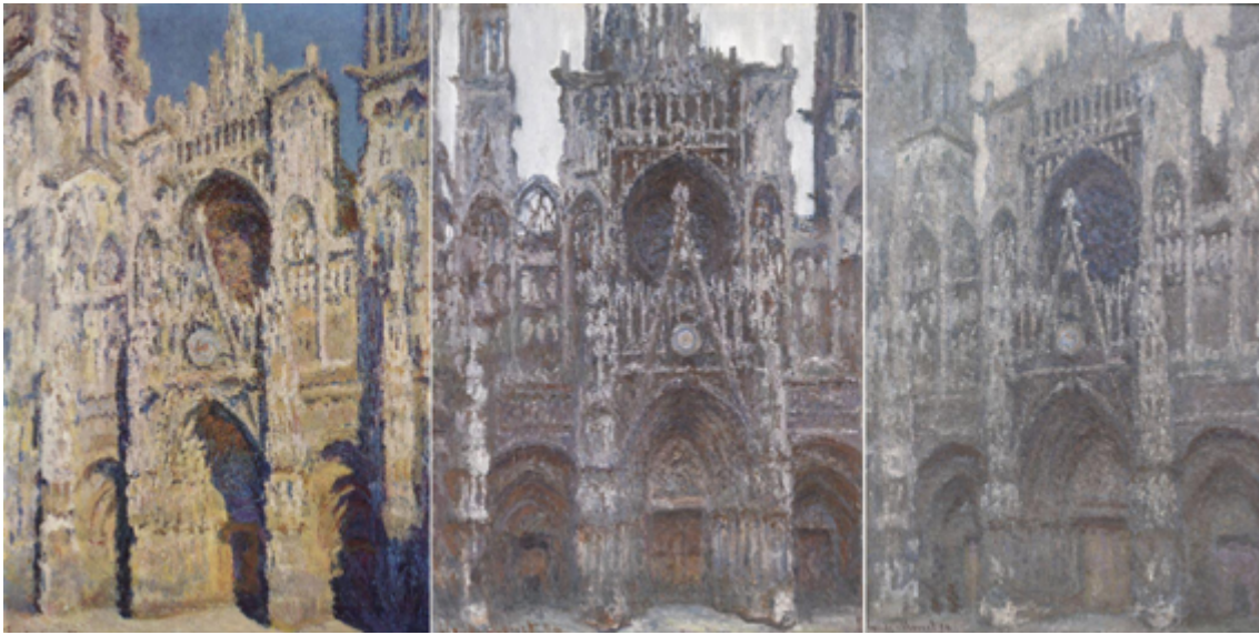
Figura 2. Monet, Serie de la Catedral de Rouen (1892-1894): a) Catedral de Rouen. El Portal y la Torre Saint-Romain, a plena luz del sol. Fuente. Licencia: Dominio Público. b) Catedral de Ruán. El portal visto de frente, Harmonie brune. Fuente. Licencia: Dominio Público. c) La catedral de Ruán. El portal, Tiempo Gris. Fuente. Licencia: Dominio Público.