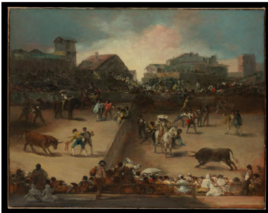
Figura 1. Francisco de Goya, Corrida en la plaza , (ca. 1810-1812, Nueva York, The Met). Fuente . Licencia: Dominio Público.