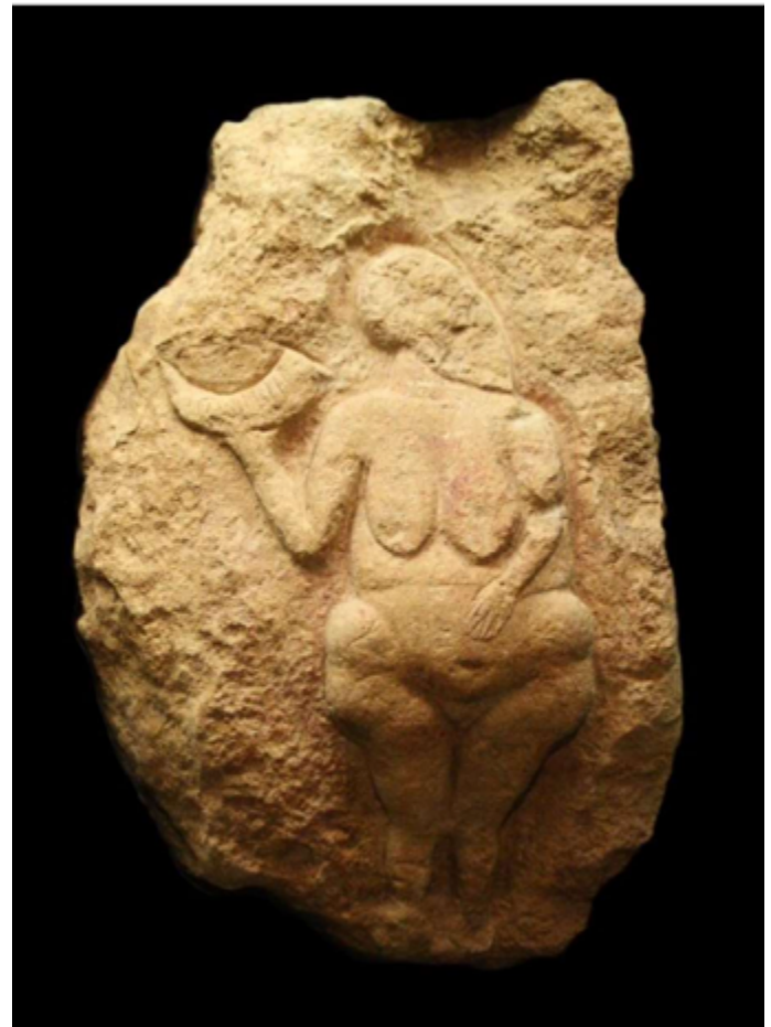
Figura 1. Venus de Laussel .

La Arqueología musical se ocupa de las evidencias materiales (Jiménez, 2021, p. 19). Los contextos arqueológicos confirman las interpretaciones realizadas y además, dan pie a hipotetizar sobre los usos y funciones de la música. A partir de los materiales encontrados obtenemos información de la cultura, lo único que nos encontramos con la problemática de si el objeto encontrado es realmente musical o si está relacionado con su práctica. Se tiene en consideración también las fuentes iconográficas . Nos confirma su existencia, nos da pistas de sus posibles formas de ejecución y permite realizar una construcción organológica más precisa -pudiendo por lo tanto acercarnos más a cómo sonaba-. Sin embargo, debemos realizar las lecturas desde un punto de vista interpretativo y no literal, pues en ocasiones el artista