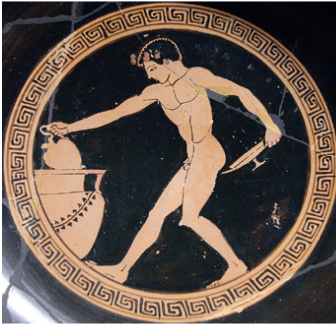
Figura 2. Copero. Museo Louvre. Fuente . Licencia: Dominio Público.

La importancia del simposio, que se debe puntualizar que era algo totalmente masculino, recae en la voluntad de los comensales de charlar y hacer fuertes los lazos entre sí. Los banquetes, al igual que los simposios, eran una manera de hacer visibles los lazos comunitarios, pero también era el momento de reunión de un grupo de personas que tenían las mismas referencias divinas y políticas que podían ser reproducidas en el mismo entorno, ya que se encontraba dentro de toda una esfera de ritualidad divina pero también política (Reyero, 2000, pp. 23 y 230).