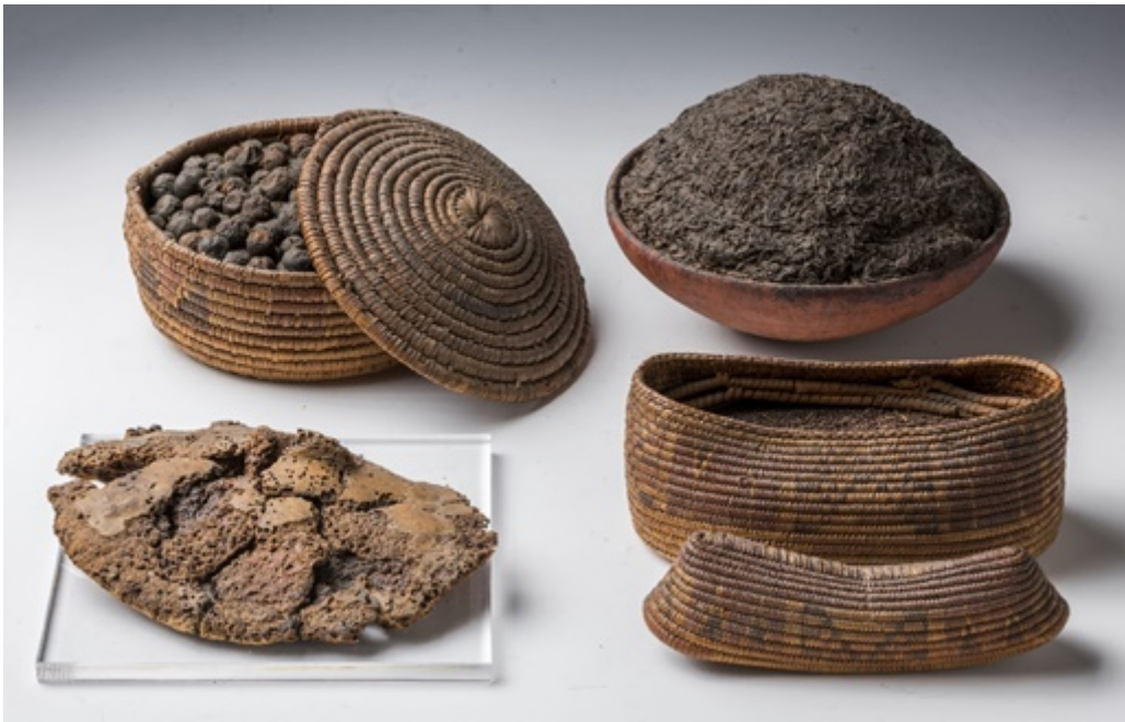
Figura 3. Cestos con comida. Fuente . Licencia: Dominio Público.

Es un detalle particular la presencia de pescado, ya que no era uno de los alimentos utilizados para ofrendas funerarias. Aunque también, en el 3477 de Saqqara de la II dinastía de una dama anónima perteneciente a la nobleza, también tiene entre sus comidas, pan, aves, carne de res, tortas, frutas como el higo, vino e incluso una especie de queso, y también había un pescado cocinado y presentado sin cabeza (Emery, 1961).