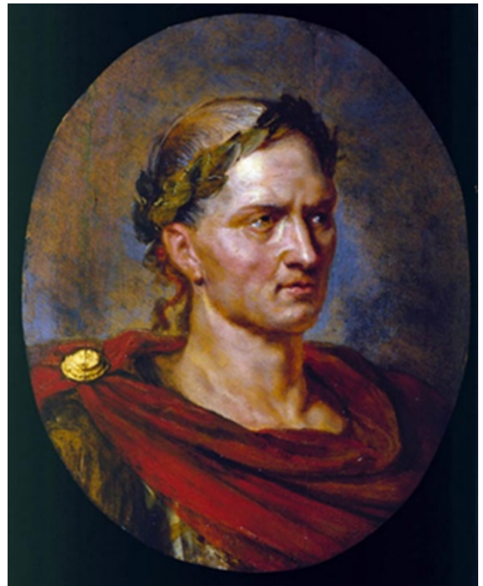
Figura 1. Julio César, óleo de Pieter Paul Rubens (1619).