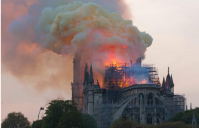
Figura 4. Incendio de Notre-Dame de París, 15 de abril de 2019.

grandiosa, obra de un erudito como Alavoine (Eck, 1842, p. 26). Jean-Philippe Desportes afirma que el artista gótico hubiera preferido el hierro, de disponer de una técnica como la actual, y Félix Tourneux y otros afirmaron que la arquitectura gótica era la que mejor se adaptaba al hierro fundido (Tourneux, 1841, p. 418). Será la corriente de Michel Chevalier, Louis-Auguste Boileau y otros, aunque siempre en la senda de limitar lo gótico al período Flamígero, como bien critica Viollet-le-Duc: