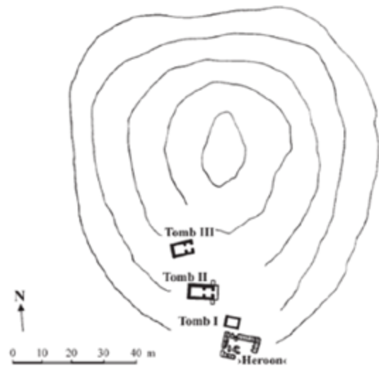
Figura 2. SEQ Figure \* ARABIC 2: Planimetría del Túmulo de Vergina.

Tras la muerte de Alejandro Magno en Babilonia en 323 y el consecuente conflicto que derivó en los Pactos de Babilonia , se acordó que Filipo III , hijo de Filipo II con la tesalia Filina (Antela-Bernárdez, 2021) y hermanastro mayor de Alejandro, fue elegido rey hasta que Roxana (esposa de Alejandro) diera