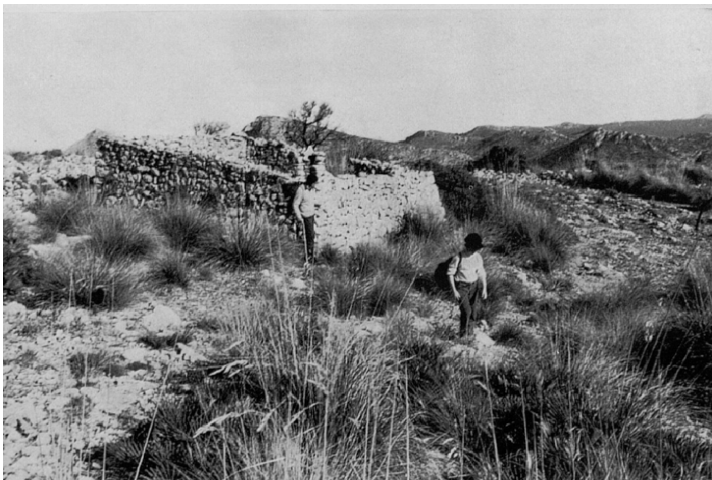
Figura 2. Dos excursionistas pasando cerca de una caseta de roter en Artá (Mallorca) durante la década de los años 60 del siglo XX ( Rutes Amagades de Mallorca , 1967, fotografía 56).

Con la respectiva rota asignada, los roters , ya porque era la única tierra que tenían o porque se encontraban lejos del núcleo de población más próximo, empezaron a construir estructuras para poder vivir en la rota . Por ejemplo, en el caso de Artá, el municipio donde hemos centrado la investigación, las rotas que hemos analizado se encuentran a unos 6 km del pueblo, teniendo en cuenta los desniveles y las zonas de difícil acceso para llegar a estos terrenos. De hecho, si fuéramos un excursionista haciendo senderismo cerca de las rotas , la primera estructura que nos llamaría la atención serían las casetas , el lugar donde vivían las familias campesinas (fig. 2). Entendiendo la filosofía de los roters , con la optimización de los recursos ofrecidos por el entorno, el material más abundante es sin duda la pedra calcàrea –muy típica de Mallorca–. En consecuencia, el material pétreo es el principal documentado en las construcciones, organizado a partir de la técnica de la piedra seca –a pesar de que