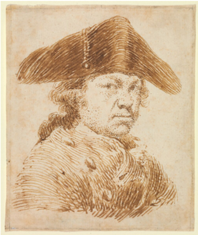
Figura 3. Francisco de Goya, Autorretrato (dibujo) , (ca. 1790, Nueva York, The Met) (Gudiol, 1970, p. 363). Fuente . Licencia: Dominio Público.